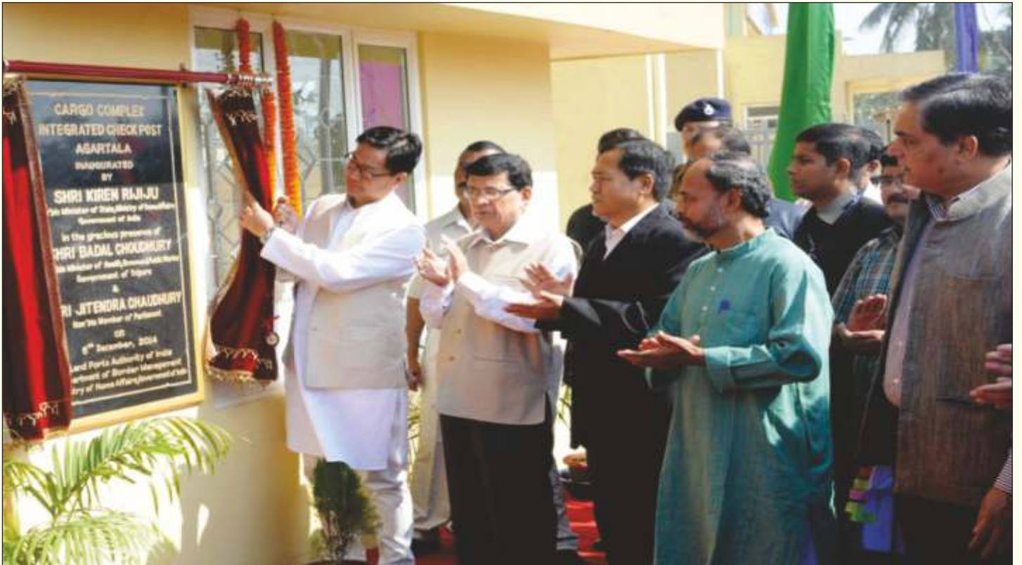
नये कार्गो परिसर का उदघाटन करते हुए श्री किरण रिजिजू, माननीय गृह राज्य मंत्री, भारत सरकार Inauguration of new cargo complex by Shri Kiren Rijju, Hon'ble Minister of State, Government of India