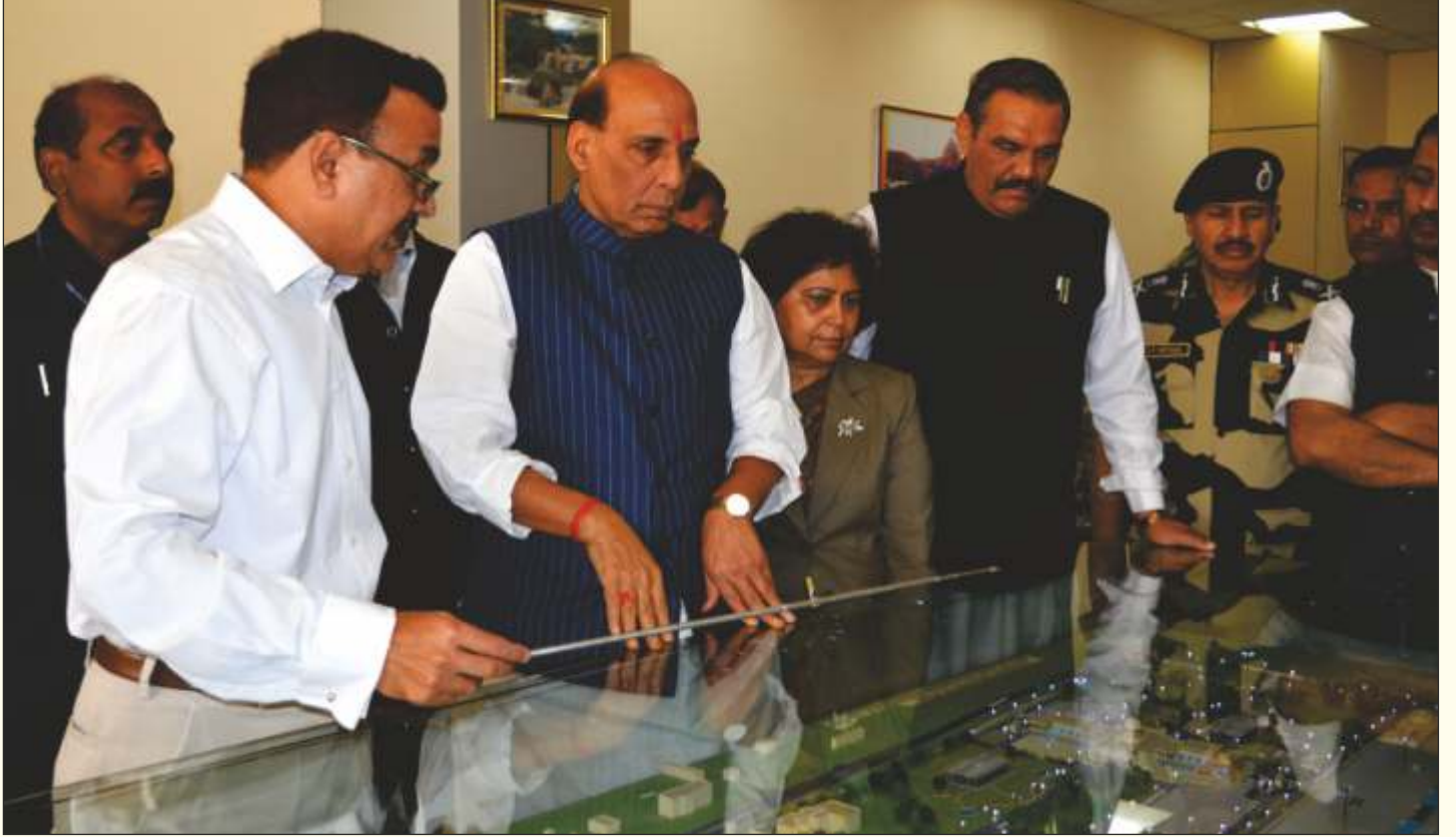
श्री राजनाथ सिंह, माननीय गृह मंत्री, आई. सी. पी. अटारी के दौरे पर Shri Raj Nath Singh, Hon'ble Home Minister visits I.C.P. Attari