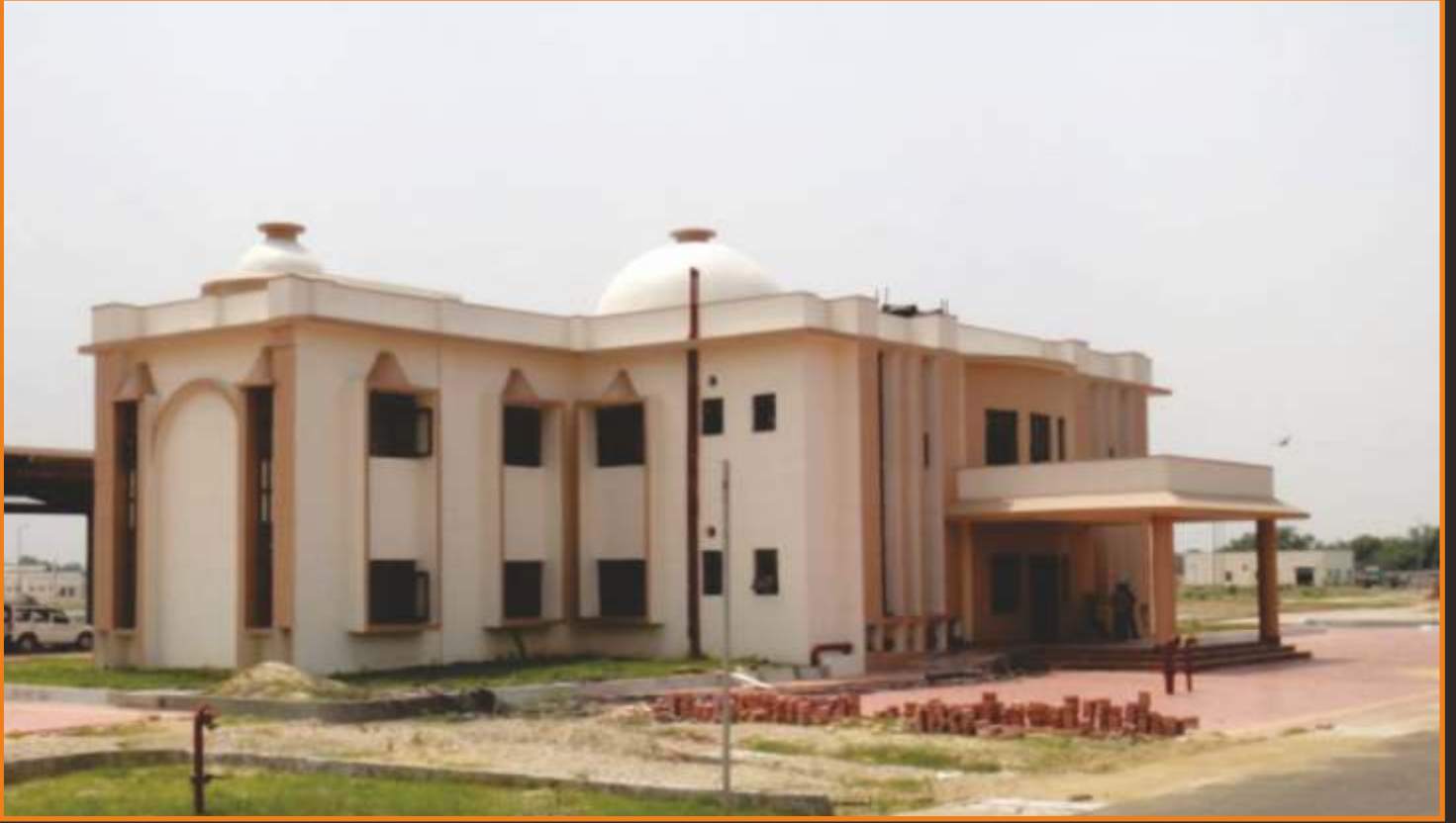
आई.सी.पी. रक्सौल I.C.P RAXAUL